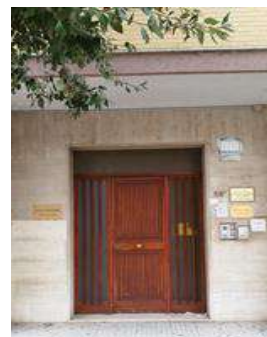
9 VIA TARANTO