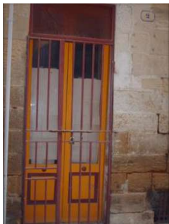
1 VICO SANTA VENERE