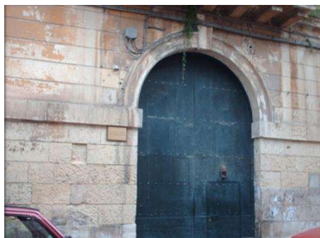
7 VIA ASCANIO GRANDI