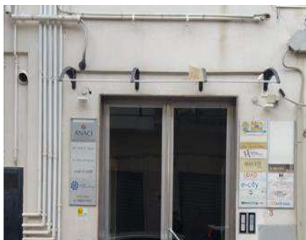
8 FRÀ NICOLO DA LEQUILE