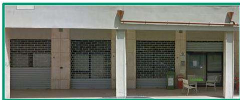
10 VIA C. ANTONACI