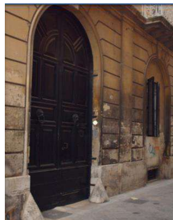
3 VIA PALADINI