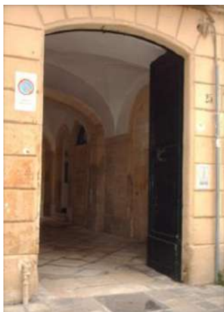
2 VIA VINCENZO MORELLI